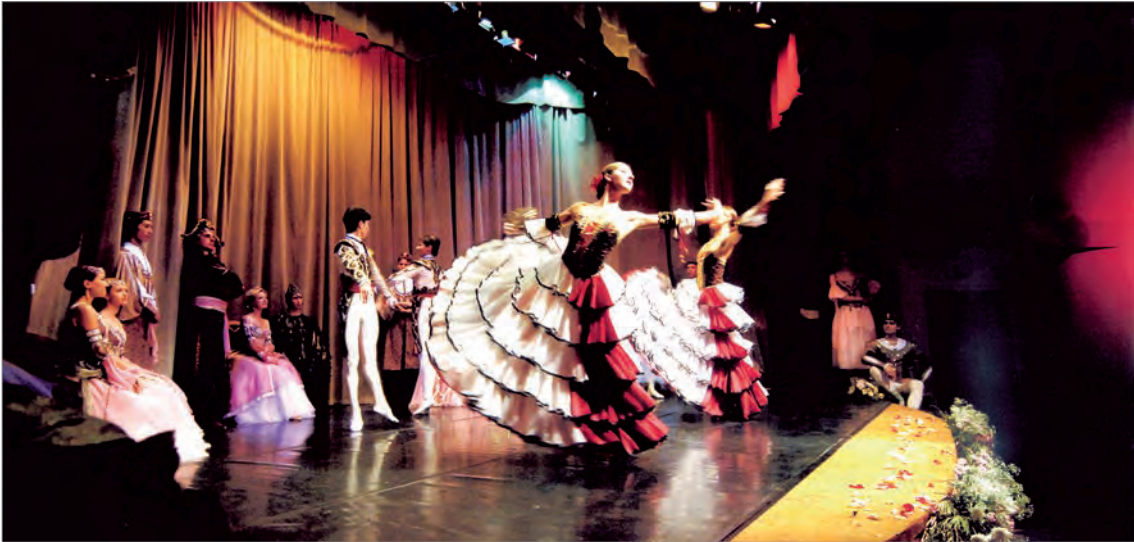
Выступление артистов Большого театра

На сцене Культурного центра выступали солисты Большого театра, артисты Людмила Зыкина и Иосиф Кобзон, исполнители классической музыки Владимир Спиваков и Денис Мацуев. С фондом «Новые имена», президентом которого является Д.Мацуев, Культурный центр и по сей день поддерживает теплые отношения.