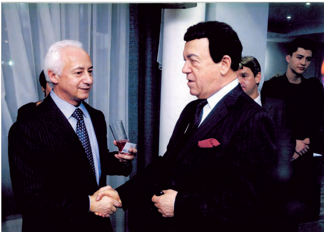
Владимир Сиваков, Иосиф Кобзон в Культурном центре

Там можно арендовать концертный зал вместимостью до 195 человек. В зале - сцена, два экрана, концертный рояль фирмы «Steinway & Sons», световое и звуковое оборудование, выдвижной подиум для проведения модных показов и кресла-трансформеры, которые устанавливаются из расчета необходимого количества мест. Таким образом, зал может быть переоборудован в танцпол или площадку для банкета или фуршета.