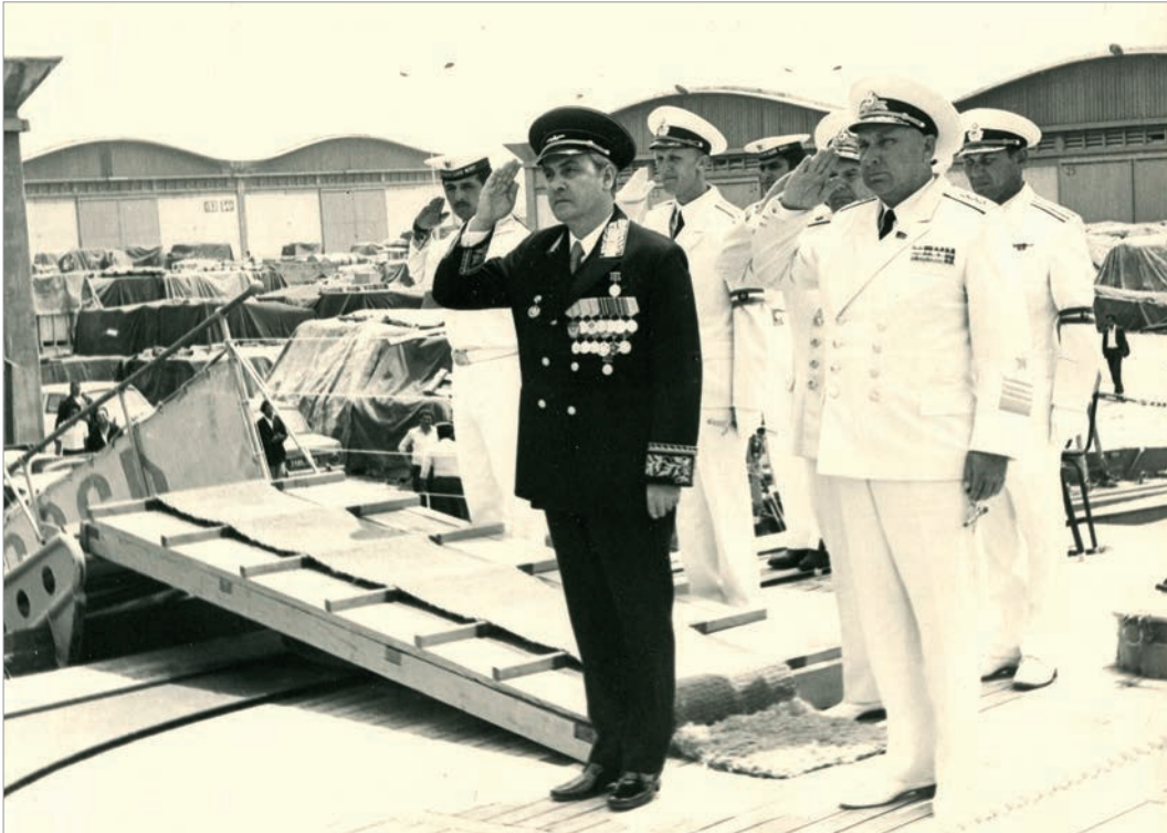
Официальный визит в Тунис командующего Черноморским флотом адмирала Н.И.Ховрина на борту флагмана Черноморского флота крейсера «Дзержинский». Июнь 1977 г.

ветское внешнеполитическое ведомство в течение 28 лет, А.Ф.Добрынина, проработавшего послом СССР в США долгие 26 лет, заместителя министра иностранных дел СССР В.В.Кузнецова, с которым у него сложились хорошие, доверительные отношения, а также С.В.Лаврова, имя которого навсегда вписано в историю нашего государства как выдающегося министра иностранных дел, последовательно, достойно и эффективно отстаивающего интересы Отечества на международной арене на протяжении более 20 лет.