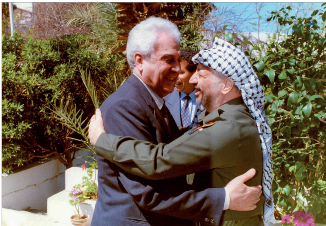
Визит в резиденцию Я.Арафата в Тунисе. 1993 г.