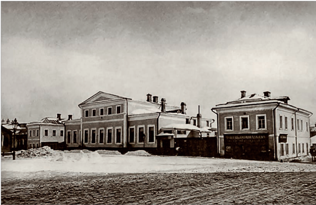
Родовой дом князя А.Б.Лобанова-Ростовского в Москве (пл. Собачья площадка в районе Нового Арбата. Снесен при прокладке проспекта Калинина в 1960-х гг.)

Николай II писал Лобанову: «Призвав Вас на ответственный пост министра иностранных дел, я руководствовался убеждениями, что найду в Вас просвещенного и преданного сотрудника, вполне подготовленного продолжать миролюбивую и прямодушную политику нашу, направленную к поддержанию дружественных со всеми державами отношений. [...] Ваш государственный ум, ваша горячая приверженность к пользам России служат мне в этом лучшим ручательством» 2 .