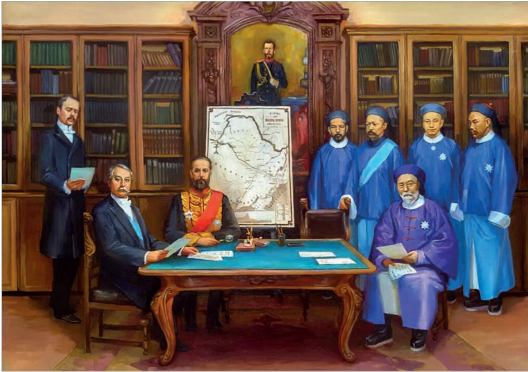
Подписание союзного договора с китайской делегацией в 1896 г. Картина болгарского художника Н.Русева

полуостров. Китайцы отказывались от своих прав на влияние в Корее и были обязаны выплатить Японии крупную контрибуцию.