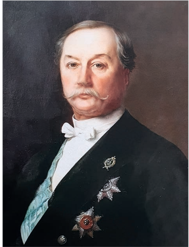
Посол России в Австро-Венгрии А.Б.Лобанов-Ростовский

Посол Лобанов докладывал в Петербург, что военные приготовления «обычно бережливой Австро-Венгрии [...] не могут не указывать на ожидание войны