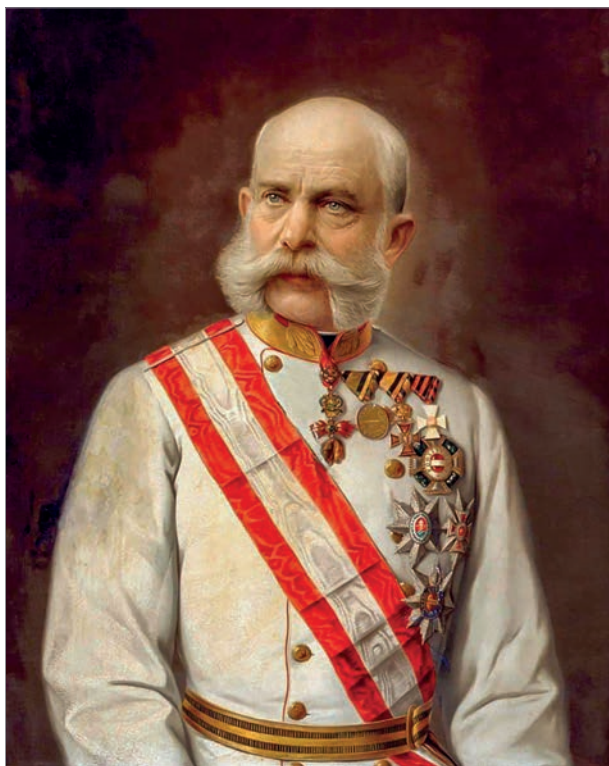
Император Австро-Венгрии Франц Иосиф

в ближайшем будущем». Высказывалось опасение, что австрийцы могут спровоцировать очередную братоубийственную войну между сербами и болгарами 24 . Вместе с тем благодаря налаженным доверительным отношениям с венским двором русскому послу удалось смягчить противоречия по болгарскому вопросу.