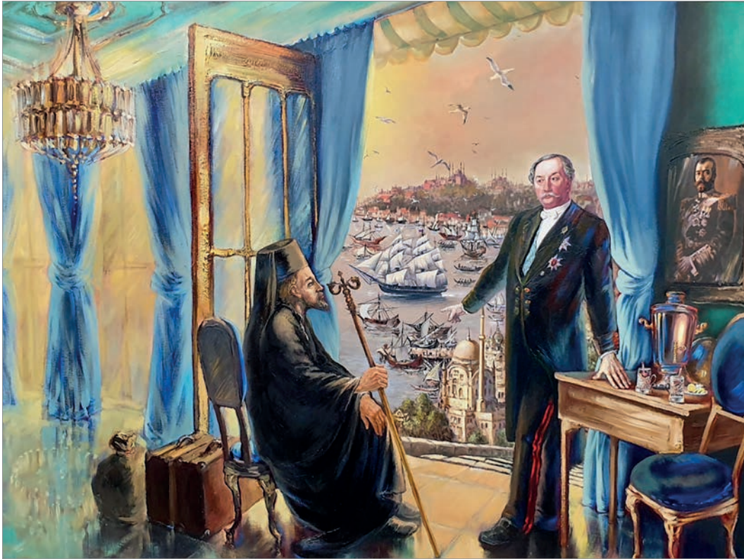
Беседа посла Лобанова-Ростовского с болгарским униатским архиепископом И.Сокольским (1861 г.). Картина болгарского художника Н.Русева

доставили на русском пароходе «Эльбрус» в Одессу, а затем на постоянное жительство в Киево-Печерскую лавру.