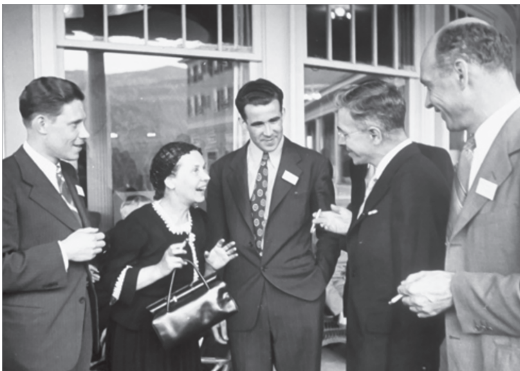
На архивной фотографии того времени запечатлены легендарный экономист Джон Мейнард Кейнс - один из отцов-основателей системы Бреттон-Вудских институтов; его супруга - русская балерина Лидия Лопокова и глава советской делегации Михаил Степанов

примере европейских стран, которые в ущерб себе перешли на покупку дорогостоящего американского СПГ вместо российского трубопроводного газа.