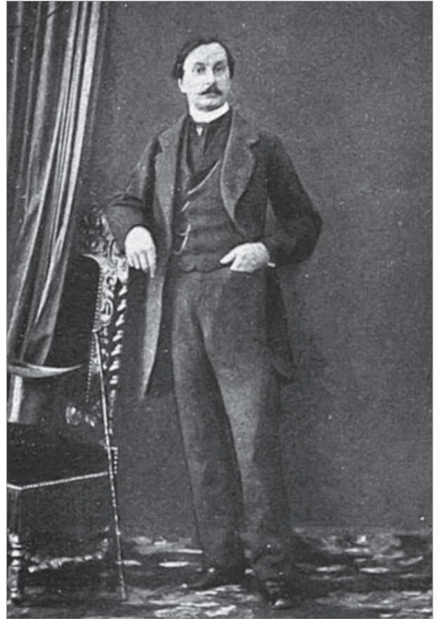
А.Б.Лобанов-Ростовский в молодые годы

Алексей Борисович родился 30 декабря 1824 года в имении матери в Воронежской губернии (с. Алексеевское, позднее - Масловка, которое ныне находится в черте г. Воронежа), однако детские годы князя прошли в Москве. Его воспитателем был француз, прививший мальчику симпатию к Франции, которая сопровождала всю его жизнь. Общение в Москве с важными вельможными старцами из обширного родительского круга знакомств пробудило в юном Лобанове интерес к историческому прошлому России и любовь к Отечеству. По воспоминаниям сослуживцев, Алексей Борисович «гордился быть русским, и это чувство не ослабело в нем потом ни под влиянием широкой европейской образованности, ни от длительного пребывания в чужих краях. До склона дней своих остался князь Лобанов верен русскому духу [...] и вся его деятельность, научная, политическая, носила истинно народный характер» 2 .