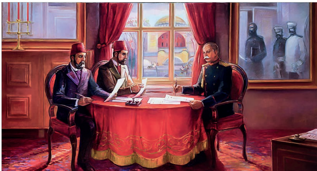
Подписание Константинопольского мирного договора в 1879 г. Картина болгарского художника Н.Русева

с балканскими народами. Экспансию Австрии на Балканах аккуратно поддерживала Германия, которая готовилась к поглощению Австрии в перспективе, разумеется, вместе с ее балканскими территориальными приобретениями.